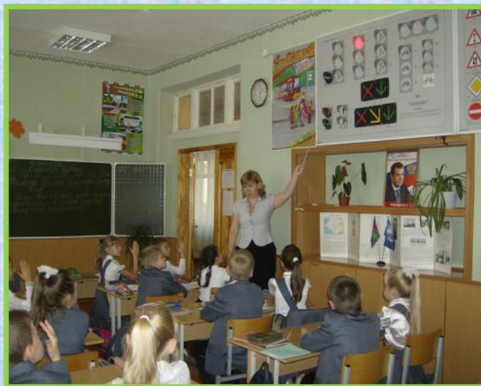
Путешествие в страну «Светофорию».